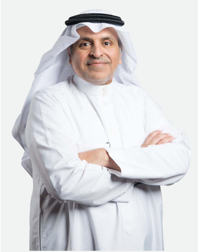
د. شَبَّاب الفامدي الأمين العام لمجلس الضمان الصحي

وانطلاقًا من دور المجلس الإشرافي والرقابي في ظل سعيه إلى أن يكون جهة تنظيمية رائدة، تم صدور قرار إيقاف اعتماد أحد مقدمي خدمات الرعاية الصحية لمخالفتها أنظمة ولوائح وقرارات المجلس.