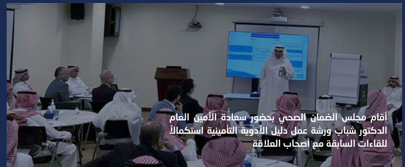
أقام مجلس الضمان الصحي بحضور سعادة الأمين العام الدكتور شباب ورشة عمل دليل الأدوية التأمينية استكمالاً للقاءات السابقة مع أصحاب العلاقة