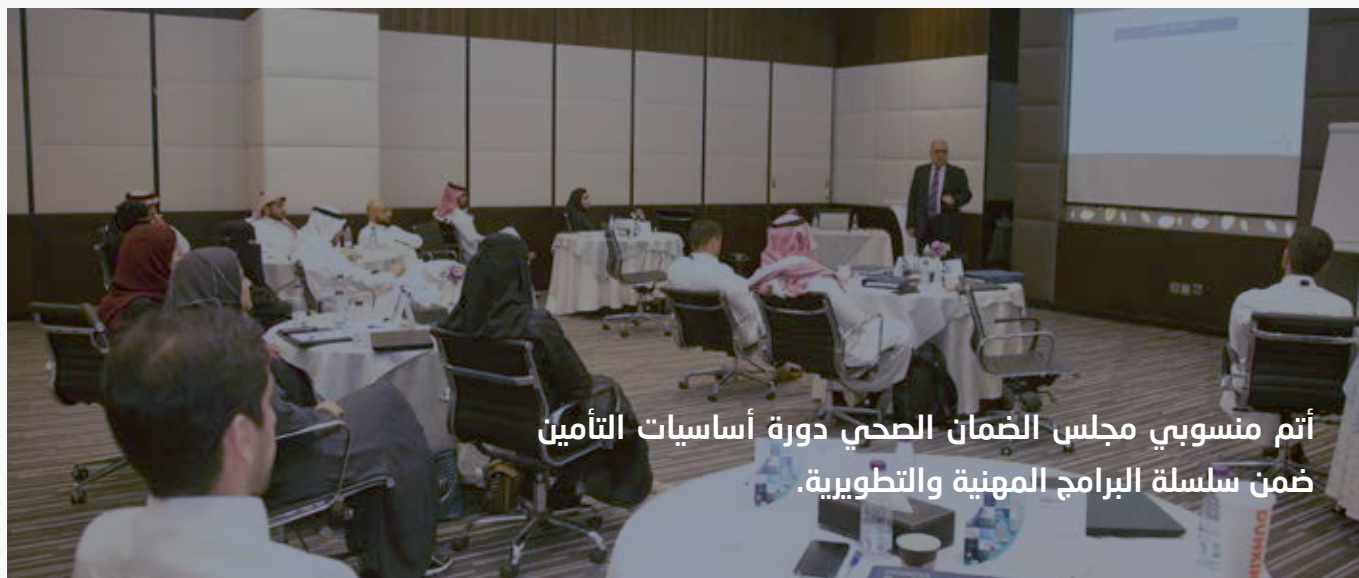
أتم منسوبي مجلس الضمان الصحي دورة أساسيات التأمين ضمن سلسلة البرامج المهنية والتطويرية.