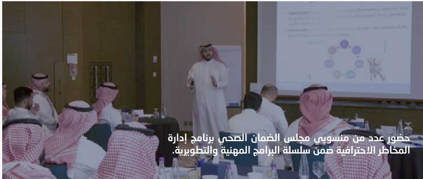
حضور عدد من منسوبي مجلس الضمان الصحي برنامج إدارة المخاطر الاحترافية ضمن سلسلة البرامج المهنية والتطويرية.