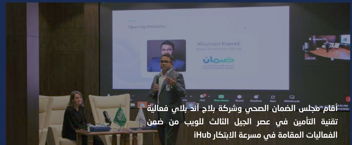
أقام مجلس الضمان الصحي وشركة بلاج أند بلاي فعالية تقنية التأمين في عصر الجيل الثالث للويب من ضمن الفعاليات المقامة في مسرعة الابتكار iHub